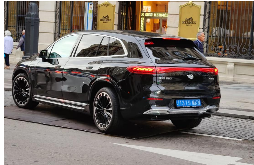
Kuvassa edustusauto, jossa värilliset rekisterikilvet kertovat auton olevan rekisteröity luvanvaraiseen liikenteeseen.

Vastuullisuus: Auto on rekisteröitävä yrityksen yksinomaiseen hallintaan.